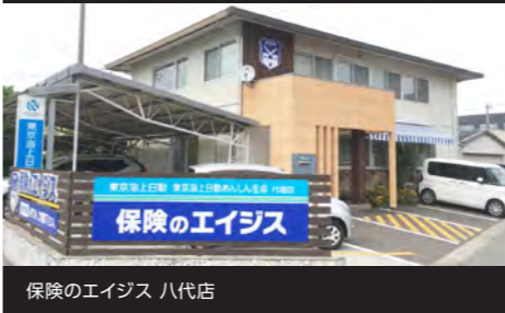
保険のエイジス 八代店